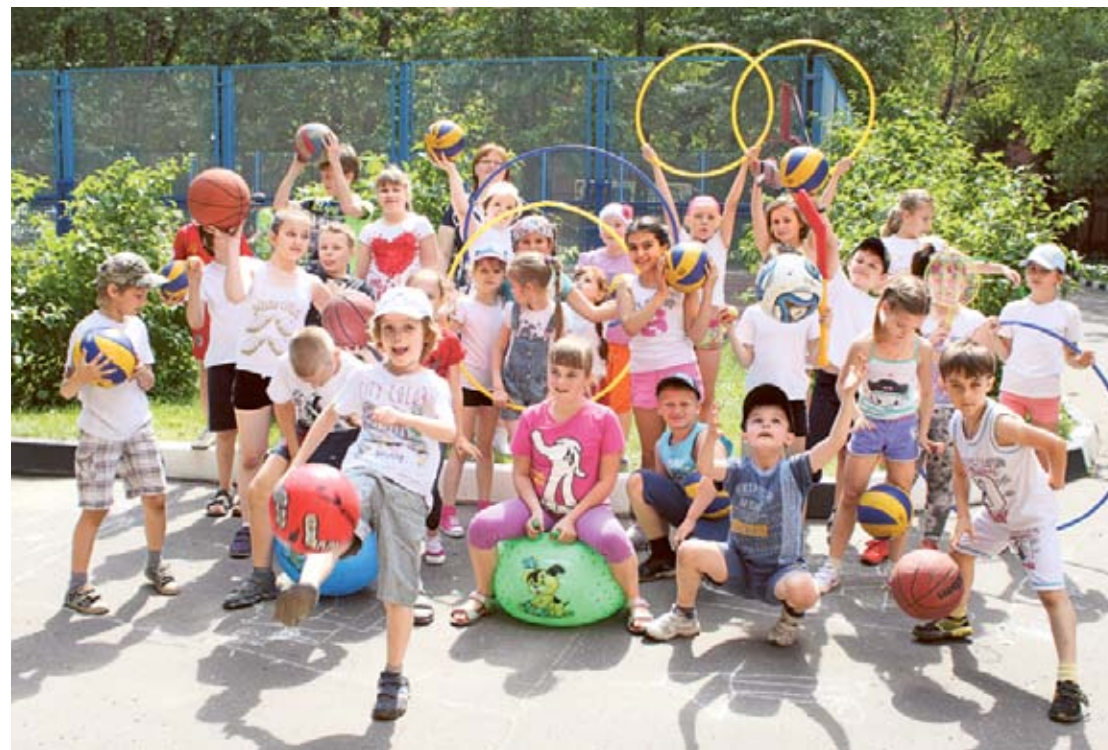
Мальчишки и девчонки поучаствовали в «Веселых стартах»